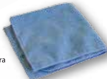
Microfiber cloth Panno in microfibra