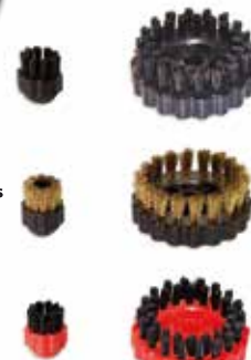
Round brush with brass bristles Spazzolino con setole in ottone