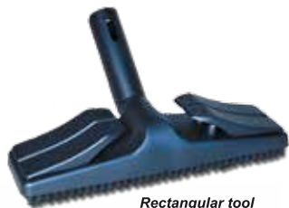
Rectangular tool Spazzola rettangolare