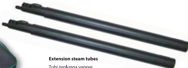
Extension steam tubes Tubi prolunga vapore