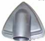
Triangular brush Spazzola triangolare