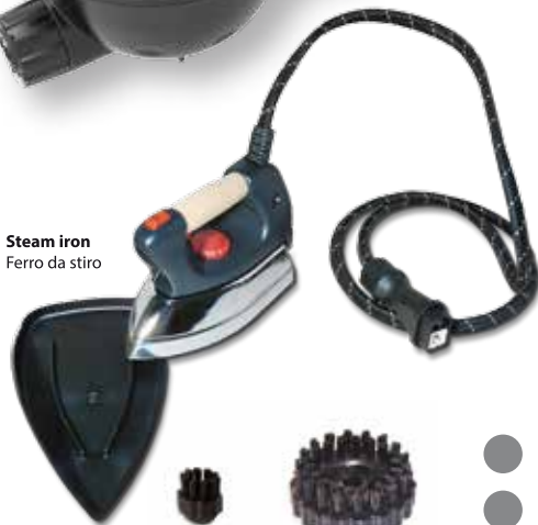
Steam iron Ferro da stiro