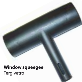
Window squeegee Tergivetro