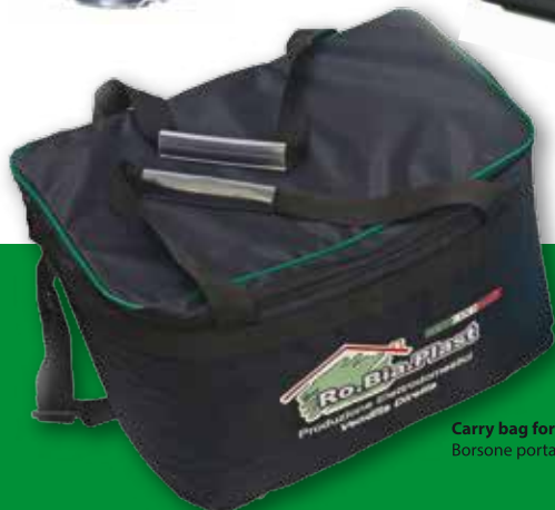
Carry bag for accessories Borsone porta-accessori