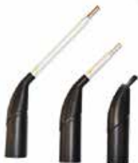
Steam Sprayer with aluminum extensions Spruzzino a vapore con estensioni in alluminio