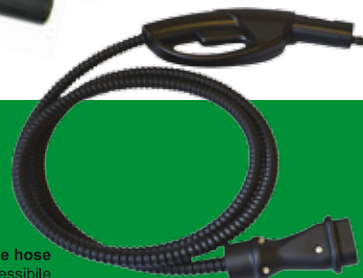
Flexible hose Tubo flessibile